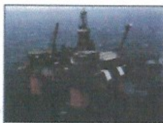
조선 / 해양