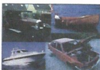
자동차 / 선박